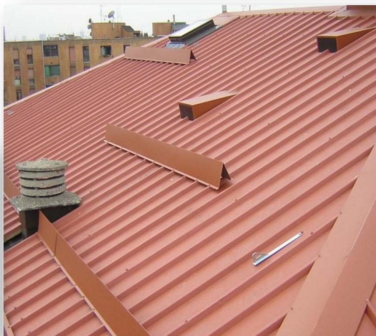
Lastra grecata (5 greche)