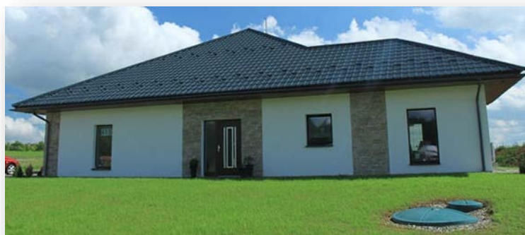
Lastra stampata tipo tegola belga con barriera anticondensa / antirumore