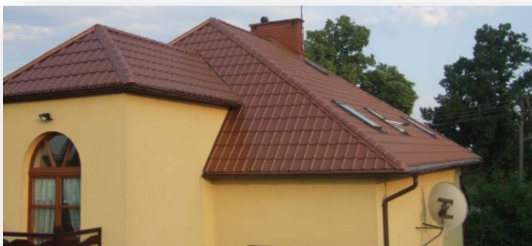
Lastra stampata tipo tegola belga