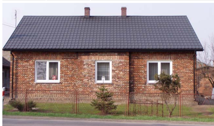
Lastra stampata tipo tegola belga